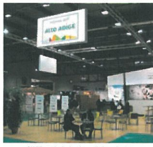
MADEExpo La Sezione legno alla fiera milanese

Nell'ambito di MADEExpo la Sezione legno, in collaborazione con Assolegno (Associazione nazionale