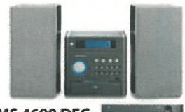
Vertiga UMS 4600 DEC