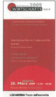
LOCANDINA Forum dell'economia